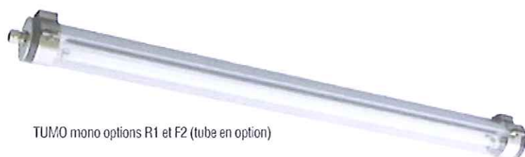
TUMO mono options R1 et F2 (tube en option)