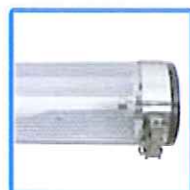
Option A1 : platine micro-perforée (tube en option)